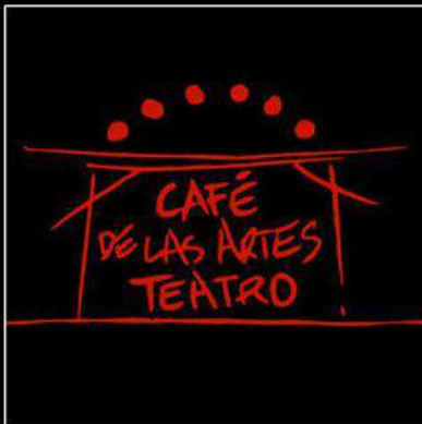
CAFÉ DE LAS ARTES (SANTANDER)